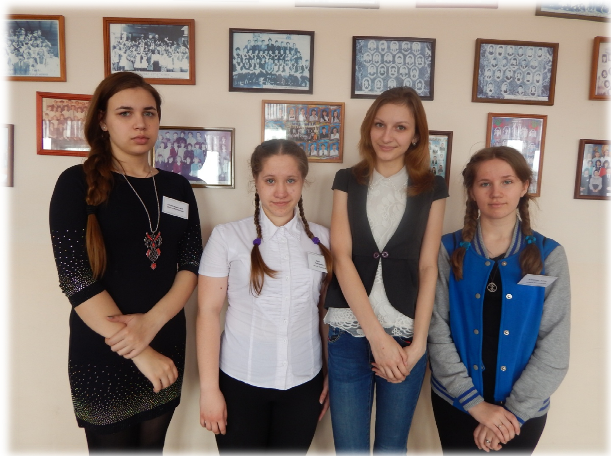
Подготовили газету «Молодежная мозаика» обучающиеся творческого объединения